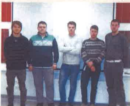
2015/2016 - Metinātāji