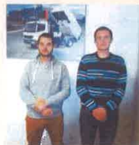
2015/2016 - 4.kurss