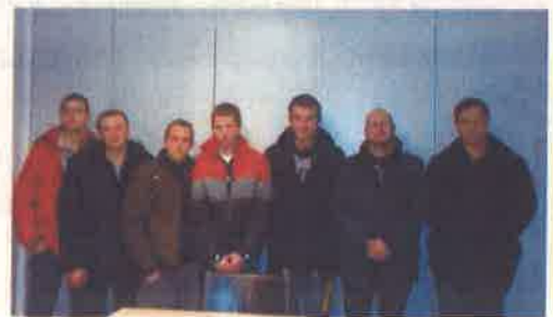
2014/2015 - Metinātāji