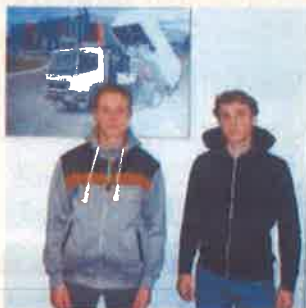
2015/2016 - 3.kurss