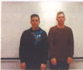
2015/2016 - 2.kurss