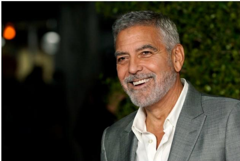
Džordžs Klūnijs ( George Clooney )

Personvārdu atveide latviešu valodā ir citvalodu cilmes personvārda izteikšana ar latviešu valodas skaņām un burtiem atbilstoši citvalodu īpašvārdu atveides noteikumiem.