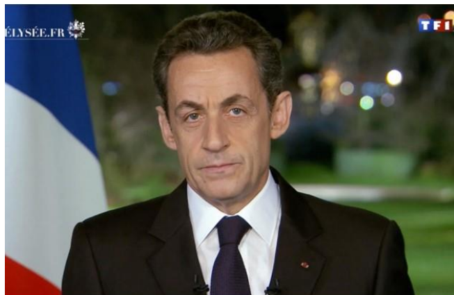
Nikolā Sarkozī ( Nicolas Sarkozy )