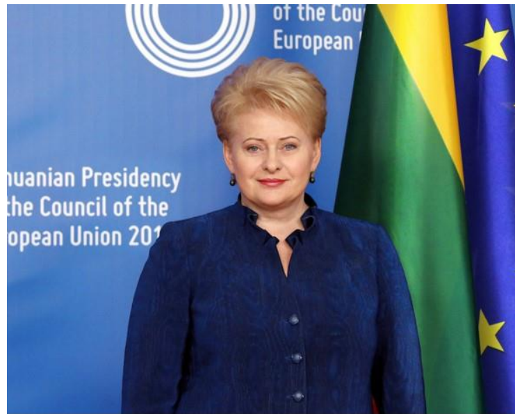
Daļa Grībauskaite ( Dalia Grybauskaitė )