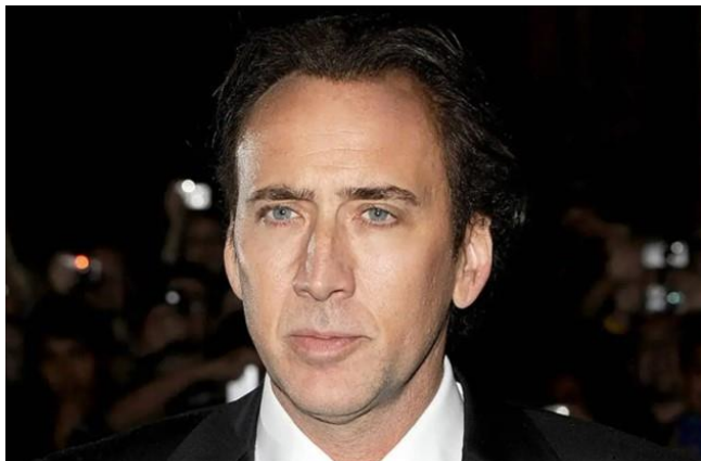
Nikolass Keidžs ( Nicolas Cage )

(Raģe, Silvija (sast.). Norādījumi par citvalodu īpašvārdu pareizrakstību un pareizrunu latviešu literārajā valodā. I. Igauņu valodas īpašvārdi . Rīga : Latvijas PSR Zinātņu akadēmijas izdevniecība, 1960, 3.–4. lpp.)