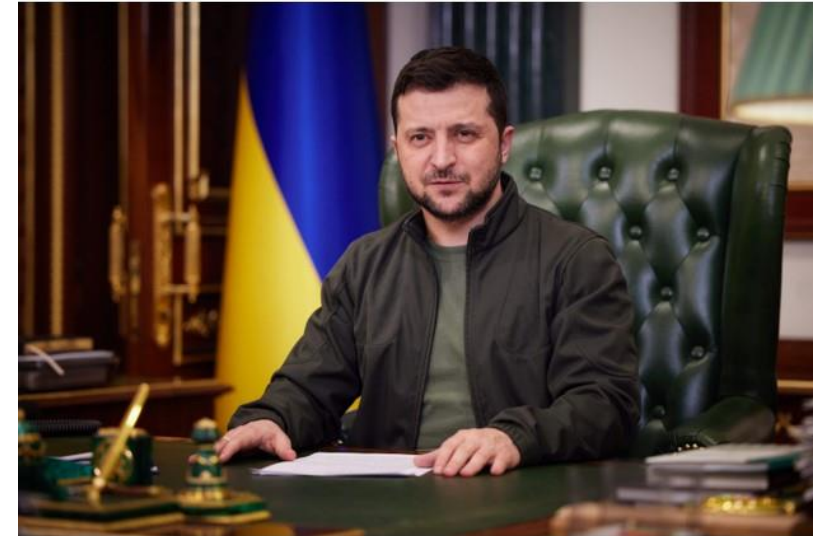
Volodimirs Zelenskis ( Володимир Зеленський, Volodymyr Zelensky )