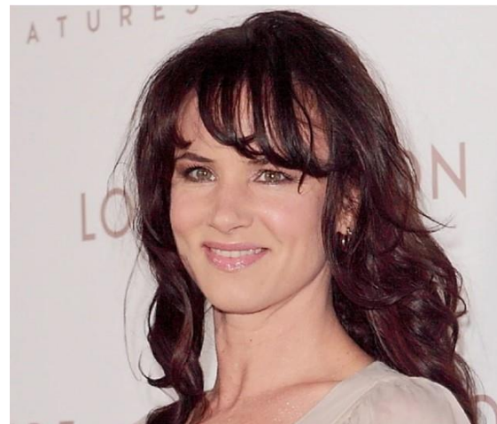
Džuljeta Lūisa ( Juliette Lewis )