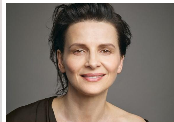
Žiljeta Binoša ( Juliette Binoche )