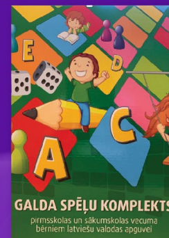
Galda spēļu komplekts