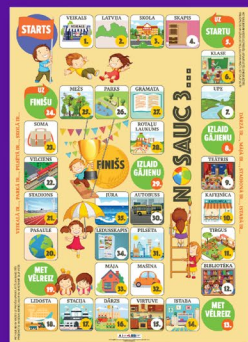
Grīdas spēle XXL izmērā