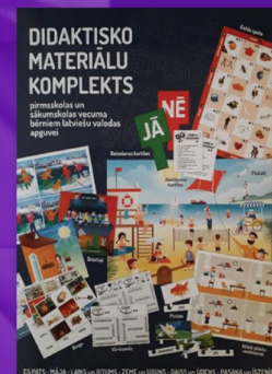
Didaktisko materiālu komplekts