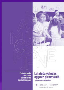
Latviešu valodas apguve pirmsskolā