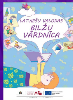
Latviešu valodas bilžu vārdnīca