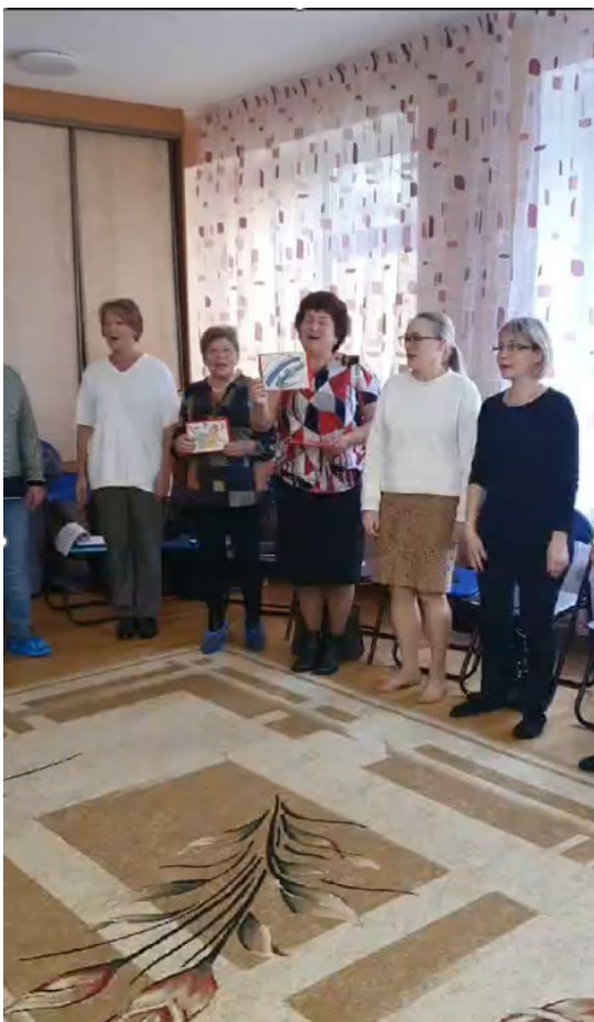
Rīgas 42. un 223. pirmsskolas izglītības iestādes pedagogi