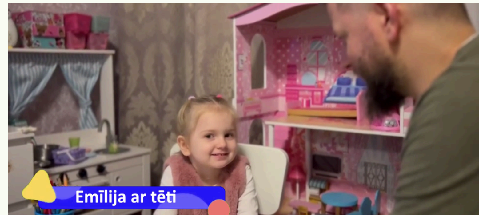
Emīlija ar tēti

Izglītības process ir uz izglītojamā personiskajām īpašībām, vajadzībām un interesēm vērsts