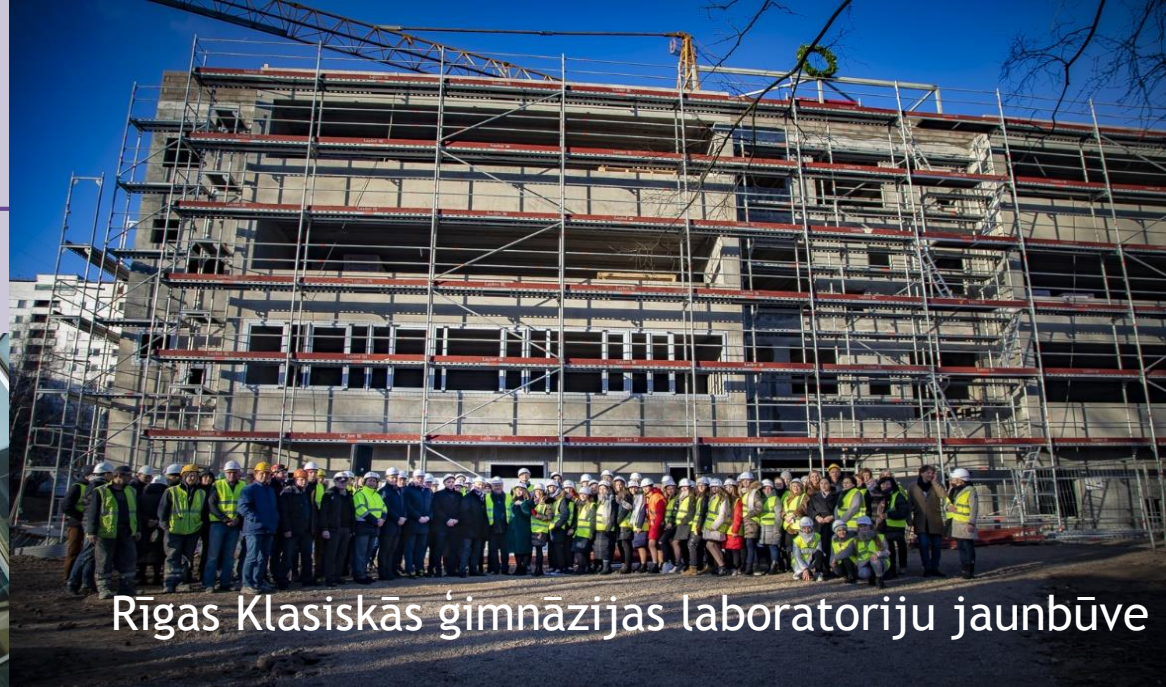
Rīgas Klasiskās ģimnāzijas laboratoriju jaunbūve

2020./2021.m.g. modernizācijas darbi tiks pabeigti vismaz 14 vispārējās izglītības iestādēs.