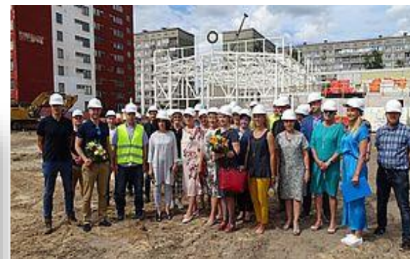
Rīgas Tūrisma un radošās industrijas tehnikumā top sporta komplekss

Pabeigti 20 objekti un nākamajos gados vēl 15 objektus