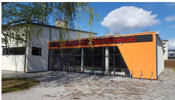
Daugavpils Būvniecības tehniskuma slēgtā poligona mācību darbnīca