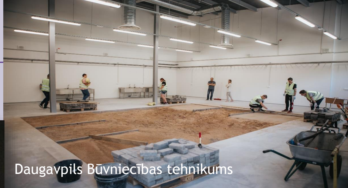
Daugavpils Būvniecības tehnikums

Pabeigtas un aprīkotas 34 izglītības programmas 12 skolās