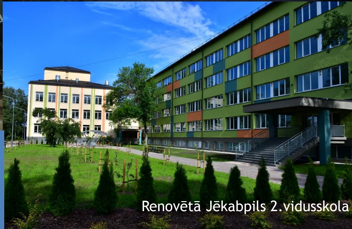
Renovētā Jēkabpils 2.vidusskola