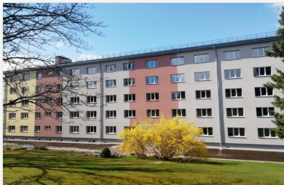
Smiltenes tehnikuma dienesta viesnīca