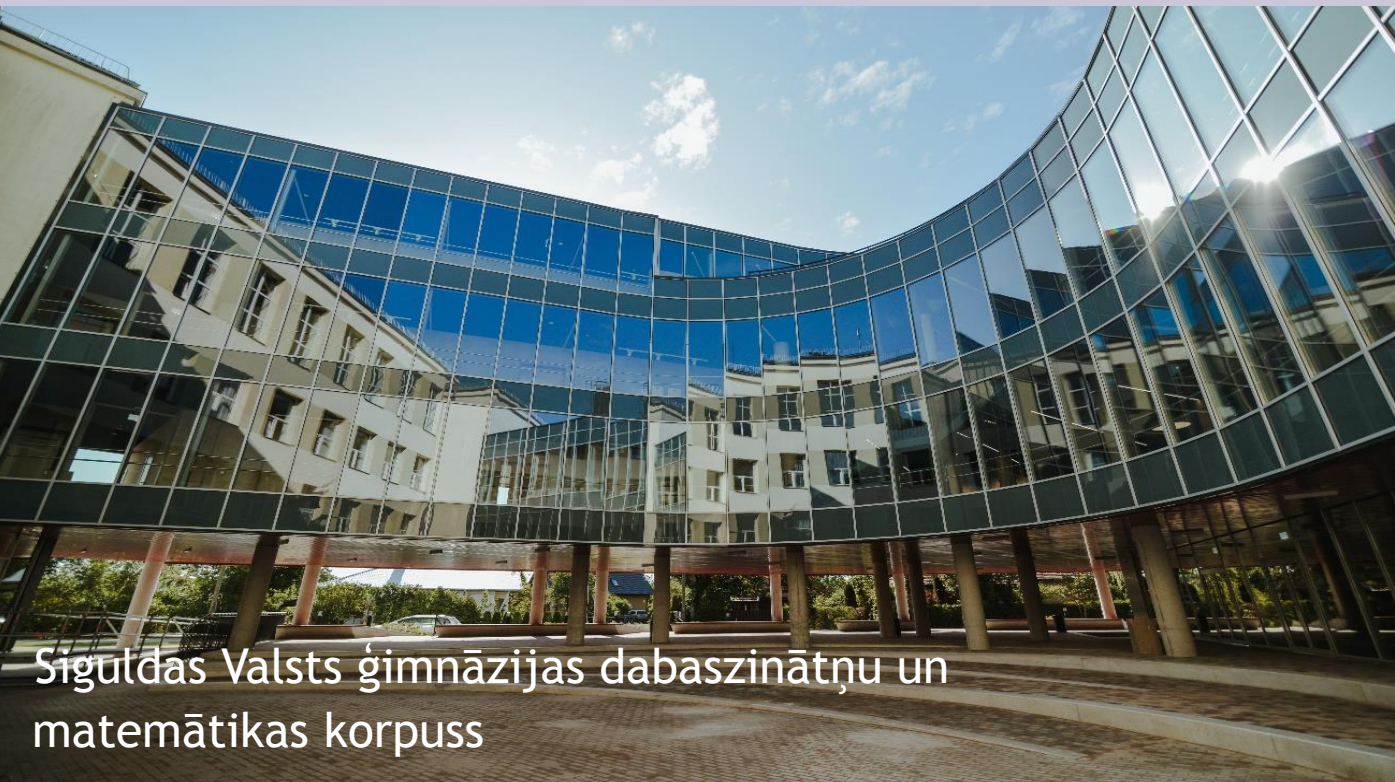
Sīguldas Valsts ģimnāzijas dabaszinātņu un matemātikas korpuss

2020./2021.m.g. modernizācijas darbi tiks pabeigti vismaz 14 vispārējās izglītības iestādēs.