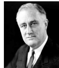
/Franklin D. Roosevelt/

The real safeguard of democracy, therefore, is education.